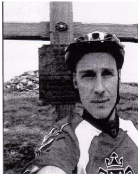
Am Millstädter See Juli 2005 in 2099 m Höhe

Es schreibt Ihnen: Verein zur Gesundheitsvorsorge e.V. Amselweg 20 53797 Lohmar Telefon: 02246 / 911880 Fax: 02246 / 911882 Internet: http://www.verein-zur-gesundheitsvorsorge.de E-Mail: info@verein-zur-gesundheitsvorsorge.de Bankverbindung : KtNr" 80220114 BLZ 305 500 00 Sparkasse Neuss